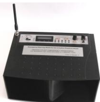
TAR de Washington