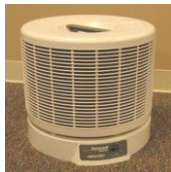
RAF de Oregon